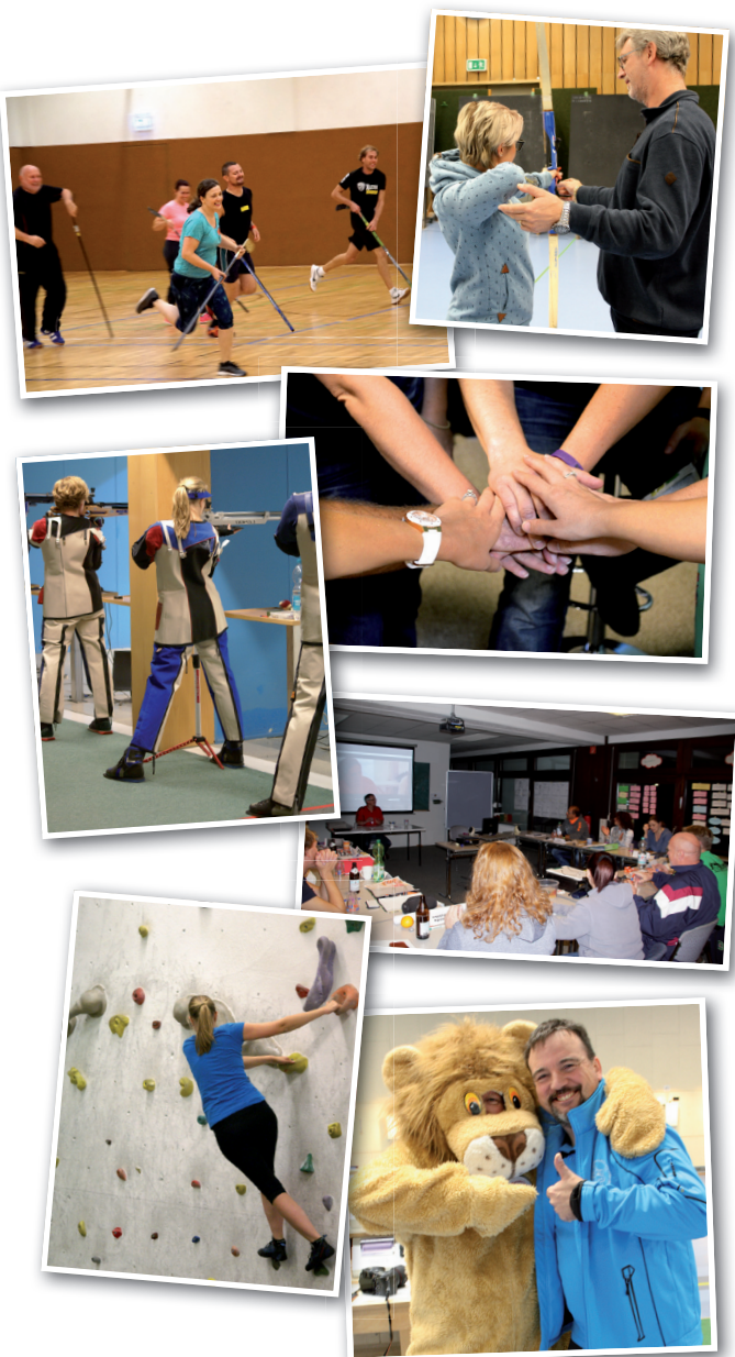
Herausgeber: Bayerischer Sportschützenbund e. V. - Bayerische Schützenjugend Ingolstädter Landstraße 110, 85748 Garching - www.bssj.de

Ausschreibung und Termin der nächsten Jugendleiter-Lizenz-Ausbildung findet ihr unter: